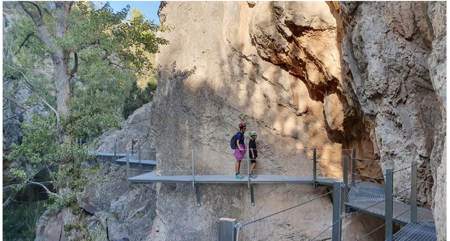
Un tramo de las nuevas pasarelas para acceder al embalse del Ecuriza.

Las antiguas pasarelas estaban en tan mal estado que el sendero era realmente peligroso. No solo para los curiosos que se acercaban a conocer el embalse,