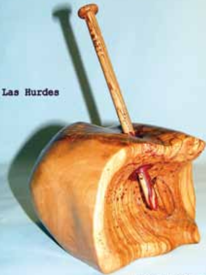
Tierra sin pan