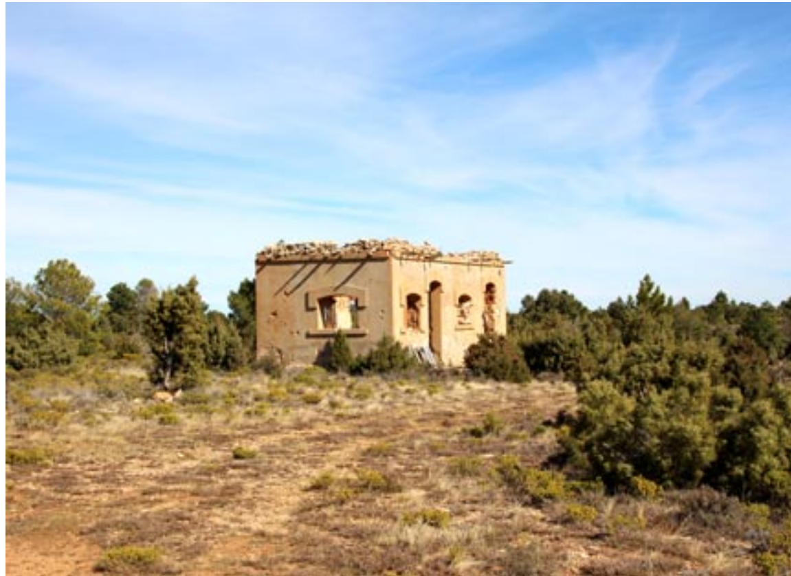
Aeródromo del Campillo, ubicado en el límite entre Ejulve y Gargallo. Cultura y Turismo Andorra-Sierra de Arcos

"Se diseñó en 1937 como punto de partida del ejército republi-