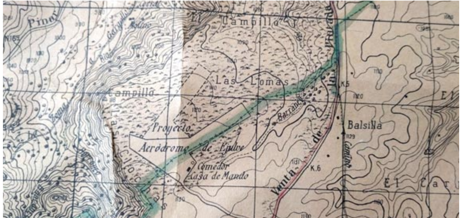
Mapa en el que se aprecia el plano del Aeródromo. Cartografía Militar de España. Plano Director. Hoja 518-I Ejulve

Entre el 9 y el 31 de marzo, las aviaciones del bando franquista realizaron un total de 285 acciones en Aragón, por solo siete de la aviación republicana, apunta Maldonado. Pese a todo, los muertos fueron escasos porque “la mayoría de la población había abandonado los pueblos y se había refugiado en las parideras, masadas, masicos o cuevas”. No