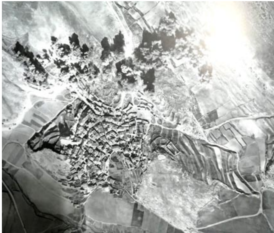
Foto del bombardeo de Ejulve, el 12 de marzo de 1938. Libro 'Marzo de 1938. Bombardeos italianos en el Bajo Aragón, 2011'